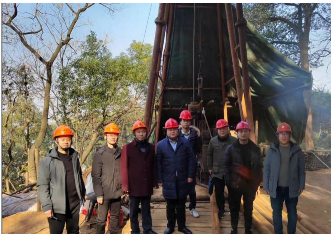
与第二地质大队安全管理人员合影

结论： 第二地质大队地质钻探作业符合国家有关法律、法规、标准、规章、规范的要求，具备安全生产条件。