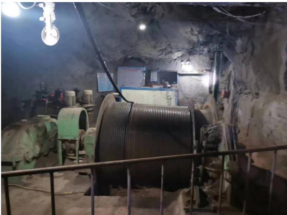
+20m 中段 3#盲主斜井提升机