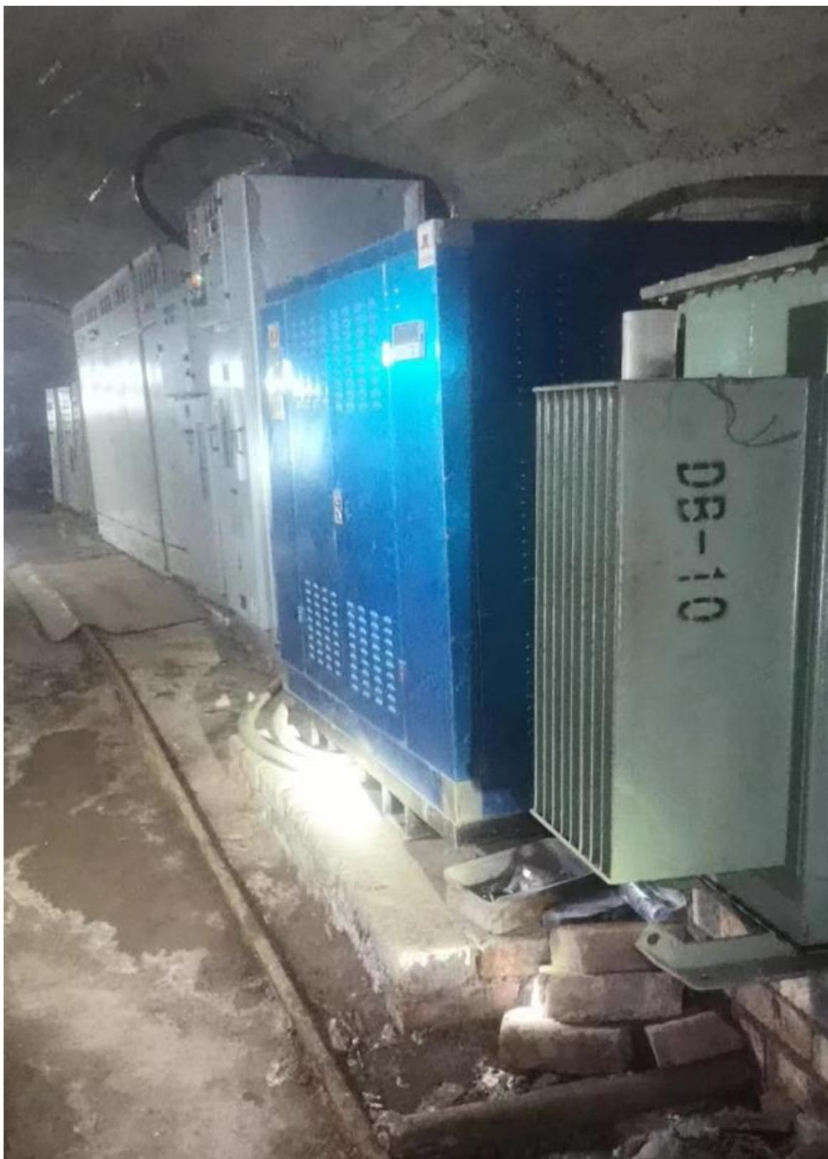
+20m 中段配电、泵房硐室